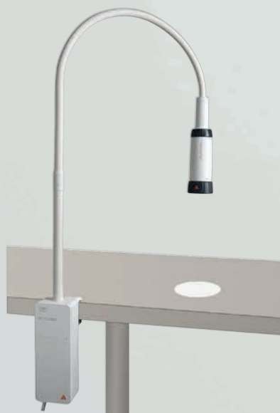
Lampada da visita EL 10 LED con fissaggio a morsetto

Per maggiori informazioni vedi: www.heine.com