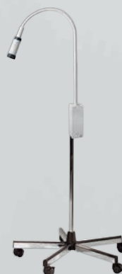
Lampada da visita EL 10 LED con stativo a rotelle in metallo