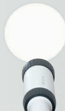
LED HQ : luce di qualità HEINE