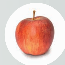
LED HQ : il rosso rimane rosso