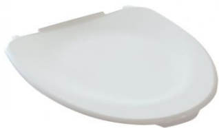
Coperchio alza wc, accessorio opzionale