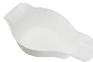
Bidet per alza wc, accessorio opzionale