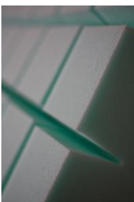
Dettaglio della struttura

Materasso studiato per la prevenzione delle piaghe da decubito.