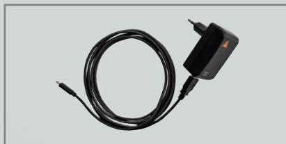
Alimentatore E4-USBC con cavo [04]