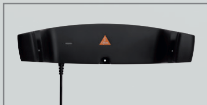
Caricatore da parete CW1 [05]