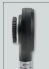
senza piastrina di contatto

Testa dermatoscopio NC 1 senza piastrina di contatto, Testa otoscopio mini 3000 LED F.O., 2 manici batterie mini 3000 (con batterie), con cadauno 5 speculum monouso Ø 2,5 e 4 mm, Astuccio con cerniera lampo [02] D-891.11.021