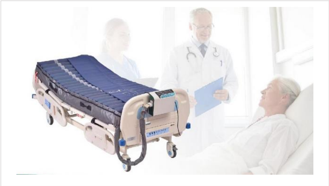
Foto puramente indicativa del kit posizionato su letto ospedaliero